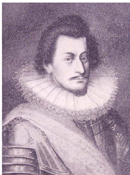
Jan Oldřich z Eggenbergu (1568-1634)

Po smrti Jana Kristiána zdědila majetek v Čechách vdova Marie Arnošta rozená ze Schwarzenbergu a po její smrti v roce 1719 jej převzal jejich synovec Adam František ze Schwarzenbergu.