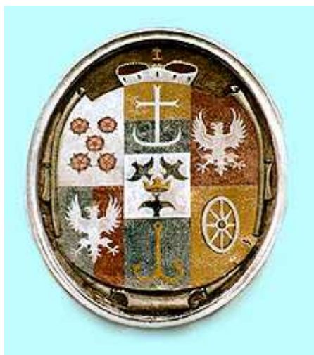
Znak knížat z Eggenberga

Eggenbergové pocházeli ze Štýrska a ze skrovných poměrů kupeckého povolání. Do Čech se dostali po likvidaci stavovského povstání a setrval zde až do svého vymření po dobu sto let. Nejvýznačnější člen rodu, Jan Oldřich (1568 – 1634) si získal naprostou oddaností důvěru Ferdinanda II. Byl jeho rádcem a měl též rozhodující podíl na jeho zvolení císařem. Za věrné služby se císař Ferdinand II. Janu Oldřichovi odměnil skutečně královsky, neboť mu donačními listy z 23. 12. 1622 a 15. 4. 1628 věnoval panství Český Krumlov, Prachatice a Netolice , dále vinice a dvůr v Křemži a Steinu v Rakousku. Uvedená panství byla spojena dohromady a jako celek povýšena na vévodství.