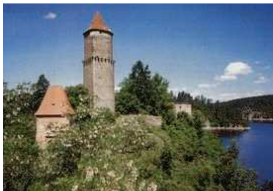
Zvíkov, od r. 1623 majetek Eggenbergů