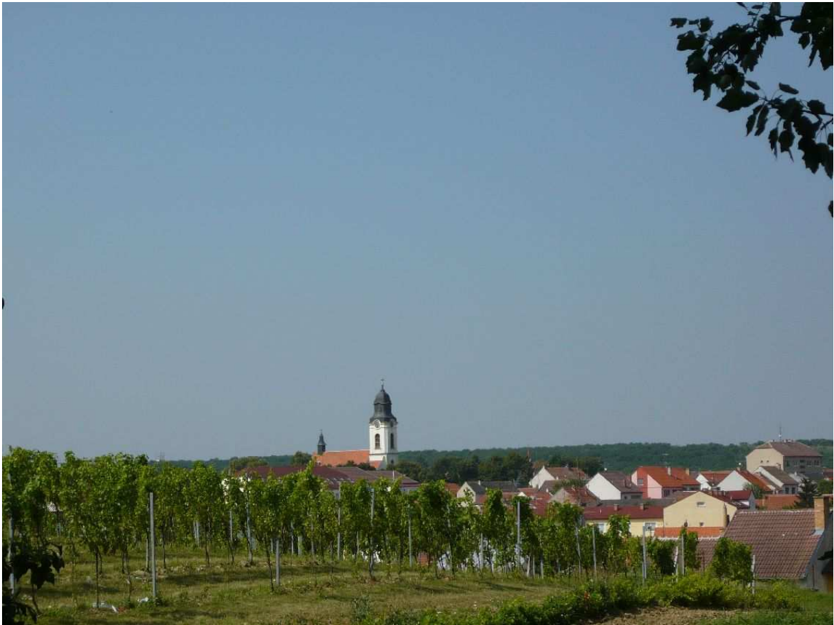
Velké Pavlovice ze Staré hory – foto 2009