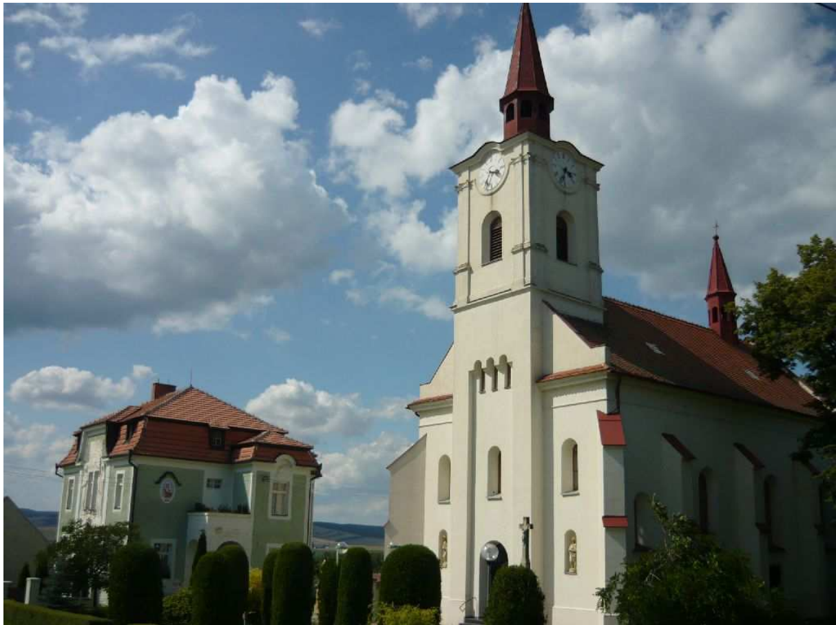
Fara (křížovníků s červenou hvězdou) a kostel ve Věteřově – foto 2009